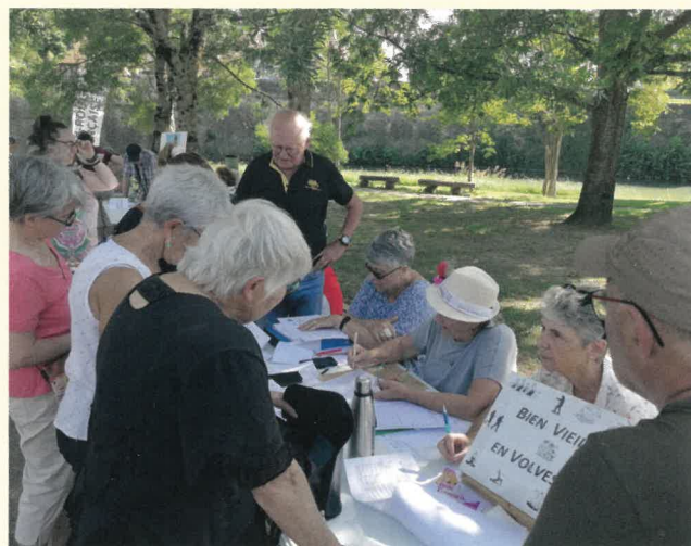
Stand de « Bien vieillir en Volvestre ».