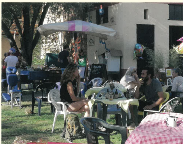
1 re édition de la buvette du café associatif au forum des associations.

Pour ponctuer cette après-midi riche en échanges, le café associatif a proposé une buvette et des pâtisseries maison, invitant chacun à une pause gourmande et chaleureuse, à l'image de la convivialité qui a régné durant ce forum.