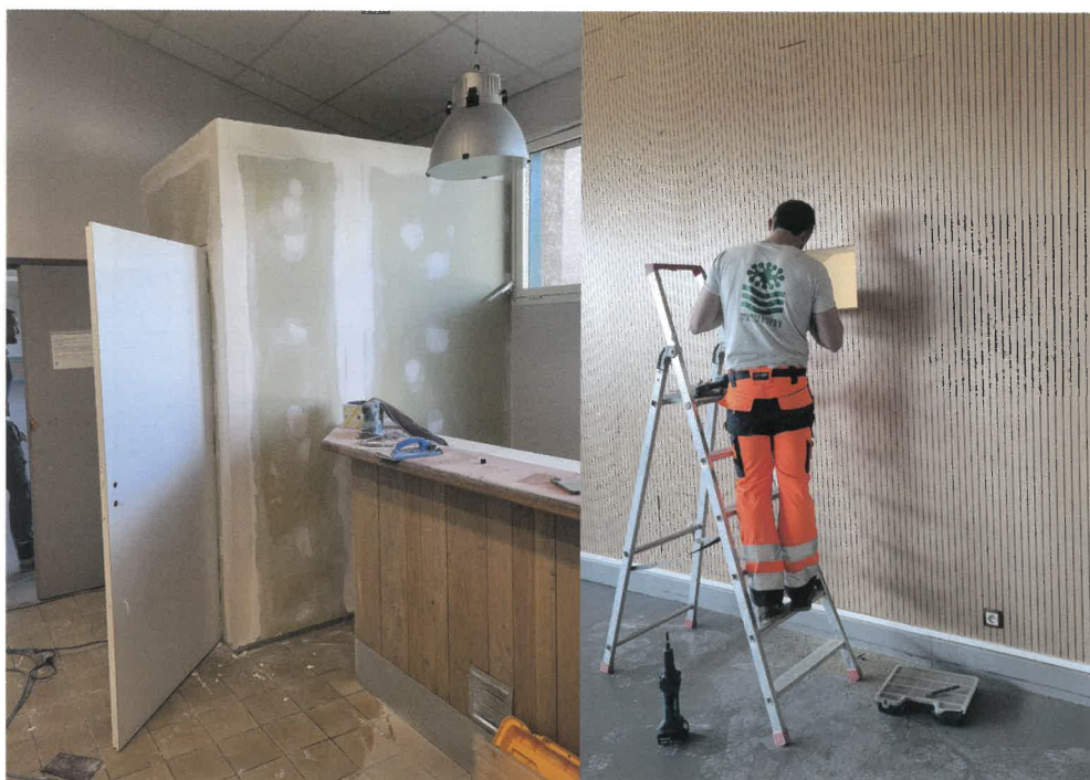
Aménagement de la cabine de projection.