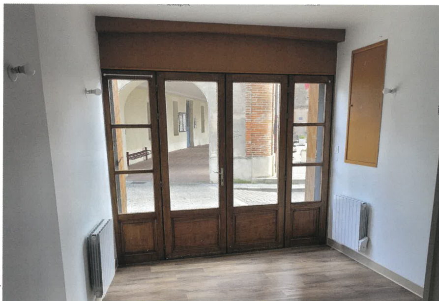
Appartement rue de l'Hospice.

La Fédération des œuvres laïques (FOL31) met à disposition le projecteur depuis septembre. Cela permettra à la section cinéma du foyer rural plus de souplesse pour la programmation des séances qui cette année sont à 20 h.