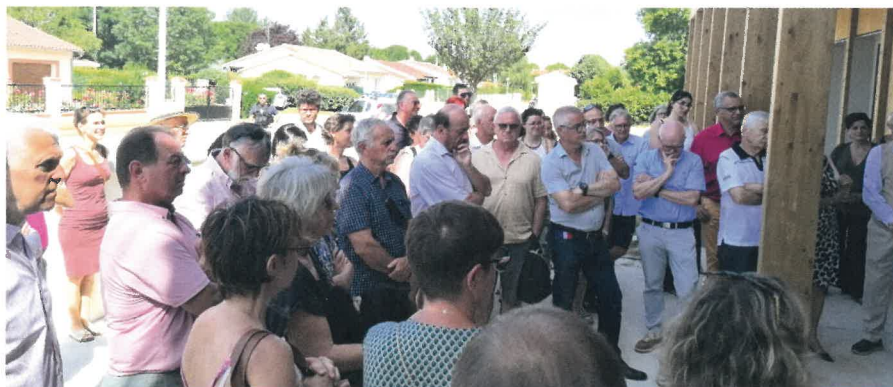
Inauguration de la maison de santé pluridisciplinaire le 1 er juillet 2025.

La maison de santé pluridisciplinaire (MSP) de Montesquieu-Volvestre a ouvert ses portes lundi 1 er septembre 2025. Initié en 2021, ce projet est la réponse concrète aux enjeux de santé publique, au service de la population locale.