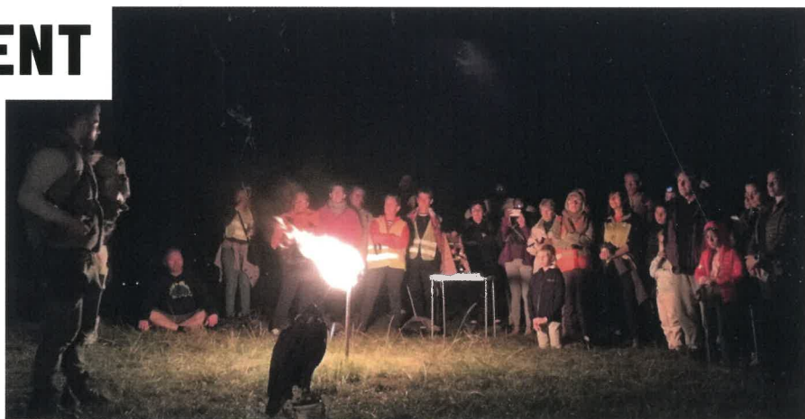
Le fauconnier et Boréale, la femelle hibou.