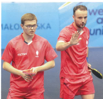
Félix Lebrun et Simon Gauzy.

Les pongistes Félix Lebrun, Alexis Lebrun et Simon Gauzy ont apporté à la France une historique médaille de bronze par équipes lors des derniers Jeux olympiques de Paris. Simon Gauzy a passé son enfance à Montesquieu-Volvestre jusqu'à l'âge de 10 ans et a fréquenté l'école de tennis (TCMV) en pratiquant en parallèle le ping-pong à Bérat. Dorénavant, avec eux, l'équipe de France de tennis de table a encore de beaux jours devant elle et peut déjà espérer d'autres belles performances dans les années à venir.