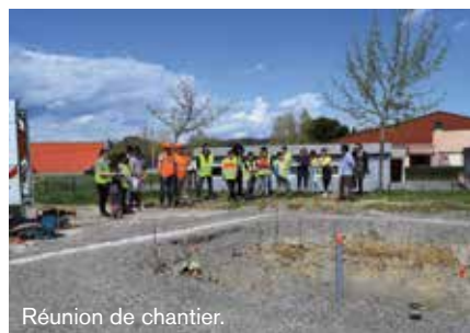
Réunion de chantier.

À noter qu'un mobilier de même type a été installé devant l'entrée de l'école élémentaire de Bonzoumet afin d'améliorer la sécurité des élèves en remplacement des barrières mobiles exigées par le plan Vigipirate.