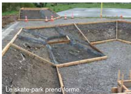
Le skate-park prend forme.