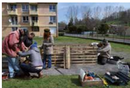
△ Fabrication des carrés potagers par les locataires. ▷ Les plans sont mis en terre.

Les locataires des HLM du Couloumé se retrouvent régulièrement autour de jardins partagés qu'ils ont créés et fabriqués, sous forme de carrés potagers en « palette ». Ce projet devrait s'étoffer prochainement de mobiliers de jardin, en bois de récupération, avec le soutien de la ressourcerie Recobrada de Cazères. Les mots-clés autour de ce jardin : partage, respect, échange, récupération, recyclage, tri sélectif, compostage, ensemble... Cette action est soutenue par le conseil départemental (avec les