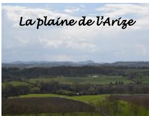
La plaine de l'Arize

Point d'Information Touristique du Volvestre 20 Place de la Halle 31310 Montesquieu-Volvestre Tél : 05 61 90 19 55 www.tourisme-volvestre.fr