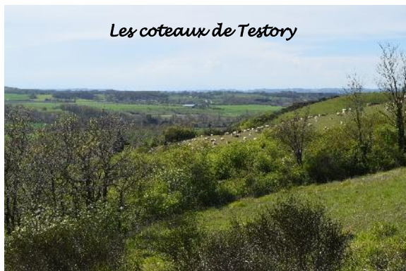
Les coteaux de Testory

Une escapade champêtre sur les chemins et routes de crêtes depuis lesquels vous admirerez le panorama sur la plaine de l'Arize, sur les coteaux du Volvestre et sur les Pyrénées. Cette balade avec plusieurs options, offre un lien pour rejoindre les chemins de Rieux Volvestre et le GR 861 VIA GARONNA.